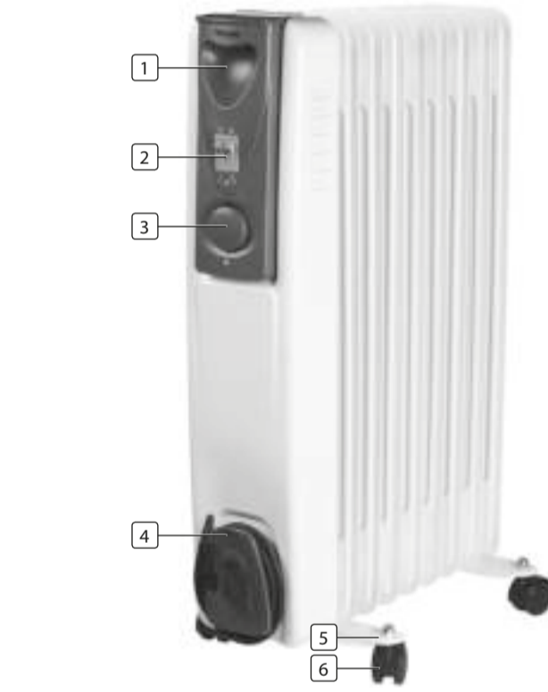
FIGURE 1. / FIGUUR 1. / IMAGE 1. / ABILDUNG 1. / FIGURA 1. / FIGURA 1. / RYSUNEK 1. / FIGURA 1. / FIGUR 1. / OBRÁZOK 1. / OBRÁZOK 1.

PARTS DESCRIPTION / ONDERDELENBESCHRIJVING / DESCRIPTION DES PIÈCES / TEILEBESCHREIBUNG / DESCRIPCIÓN DE LAS PIEZAS / DESCRICÃO DOS COMPONENTES / OPIS CZĘŚCI / DESCRIZIONE DELLE PARTI / BESKRIVNING AV DELAR / POPIS SOUČÁSTÍ / POPIS SÚČASTÍ