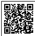
QR-Code für Software scannen

Die GPS-Software kann von unserer Website heruntergeladen werden: webshop.caliber.nl/media/Programs/DVR225A_WIN.zip Kompatibel mit: Windows 7, 8 und 10