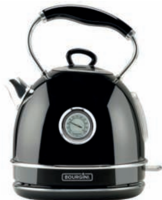
23.1009.00.00 Nostalgic Thermo Water Kettle Black 1.7L