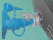
4. Zet de elektrische pomp aan. Blaas eerst het onderste gedeelte op, daarna het bovenste gedeelte