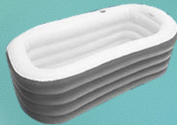
6. Klaar: het bad is klaar om gevuld te worden. Gebruik met of zonder isolatie-hoes.