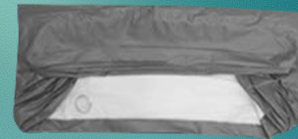
3. Vouw een derde van boven naar het midden