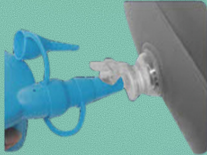
3. Gebruik de middelste maat van het mondstuk dat is meegeleverd om het bad mee op te blazen