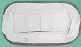
1. Vouw het bad open