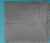
6. Berg op een koele plek op