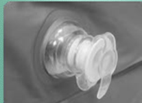
2. Draai de lekvrije ventielen open