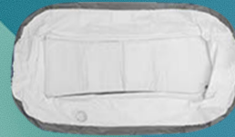
1. Laat het bad leeglopen met de afvoerpijp