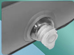
5. Draai de lekvrije ventielen vast zodat er geen lucht ontsnapt