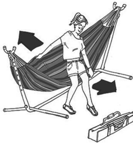
Figure 1 Abbildung 1 Schema 1 Figura 1 Figura 1 figur 1