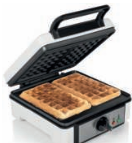
Waffle iron 01.132397.01.001

PARTS DESCRIPTION / ONDERDELENBESCHRIJVING / DESCRIPTION DES PIÈCES / TEILEBESCHREIBUNG / DESCRIPCIÓN DE LAS PIEZAS / DESCRIÇÃO DOS COMPONENTES / DESCRIZIONE DELLE PARTI / BESKRIVNING AV DELAR / OPIS CZĘŚCI / POPIS SOUČÁSTÍ / POPIS SUČASTI / ОПИСАНИЕ ЗАПЧАСТИ