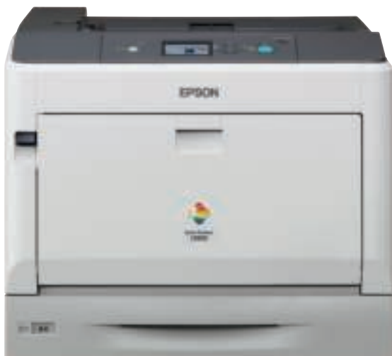
Getoonde model: AL-C9300N

Deze A3-kleurenlaserprinters van topklasse, de AcuLaser C9300N-reeks, bieden bedrijven en middelgrote tot grote werkgroepen eersteklas afdrucken die worden gerekend tot de hoogste afdrukkwaliteit in deze categorie.