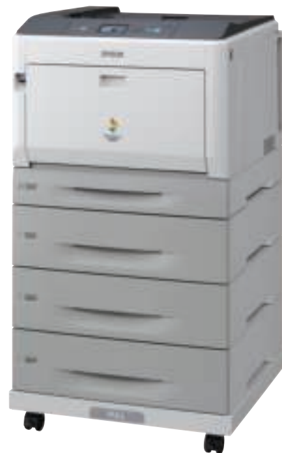
Getoonde model: AL-C9300D3TNC met mogelijkheid voor dubbelzijdig afdrucken, 3 extra papierladen en printeropzetelement