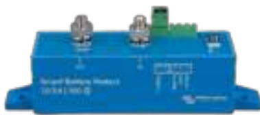
Smart BatteryProtect BP-100