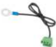
Connector met voorgemonteerde DC-minuskabel (inbegrepen)