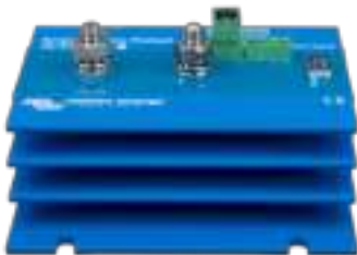
Smart BatteryProtect BP-220