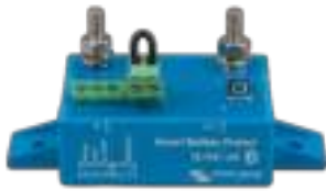
Smart BatteryProtect BP-65