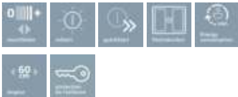
Table à induction avec de nouvelles fonctions innovantes, pour une grande flexibilité en toute situation.