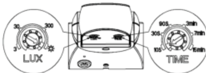
rys.4/ fig. 4/ Abb. 4