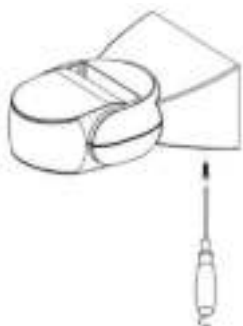
rys.3/ fig. 3/ Abb. 3