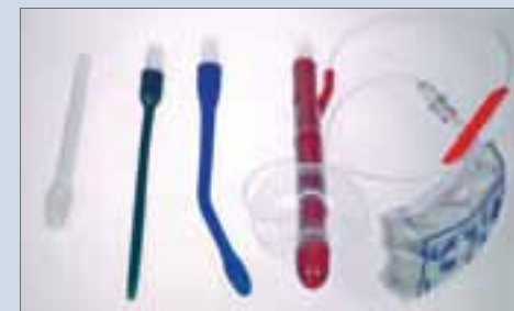
Verschillende canule's verkrijgbaar