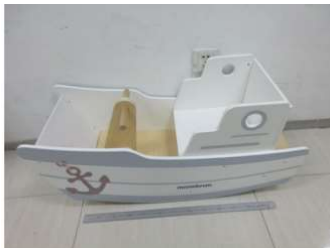
MAM125 ROCKING BOAT 5900168937048 Item: GYT22551