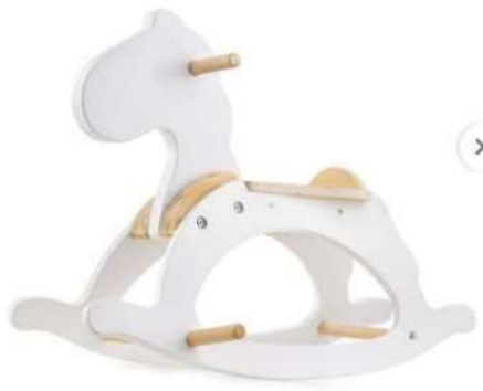
HORSE GYT2152 5900168935198 Item: GYT21152