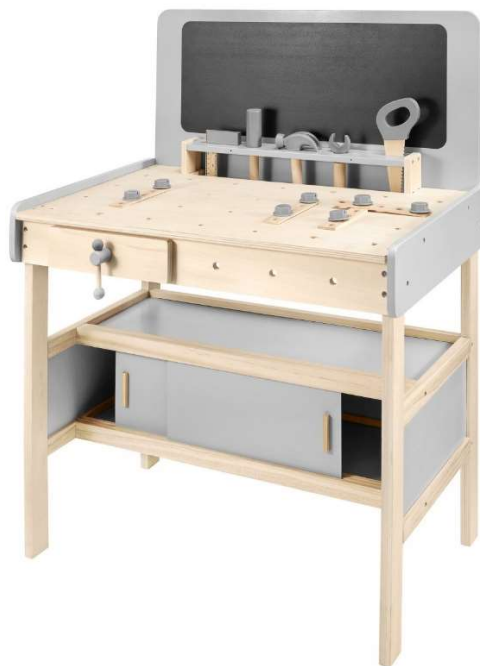
WORKBENCH GYT1987 5900168933934 Item: GYT19387, Item: GYT20156