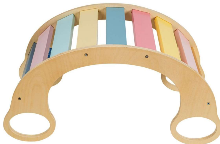
MAM122 CHILD FRAME 5900168937017 Item: GYT22552