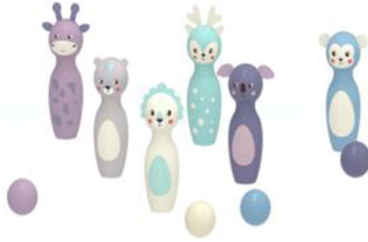
MAM126 BOWLING 5900168937055 Item: GYT20334