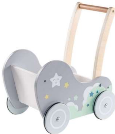
BABY WALKER GYT1929 5900168933866 Item: GYT19029