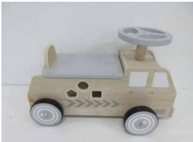
WOODEN CAR GYT2154 5900168935228 Item: GYT21154