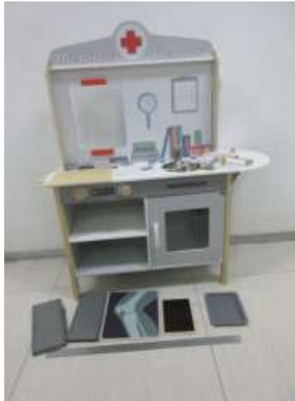
MAM123 MEDICAL SET 5900168937024 Item: GYT22605