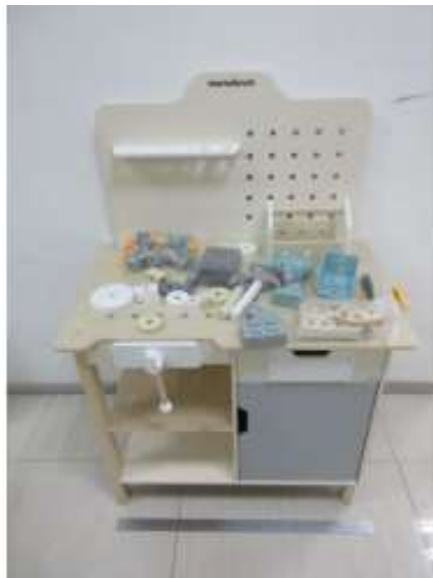
MAM124 WORKBENCH 5900168937031 Item: GYT21319