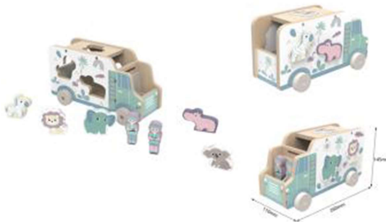
MAM128 SAFARI TRUCK 5900168937079 Item: GYT22340

Wymienione powyżej przedmioty w niniejszej deklaracji są zgodne z odnośnymi wymaganiami unijnego prawodawstwa harmonizacyjnego: Dyrektywa Parlamentu Europejskiego 2009/48/WE z dnia 18 czerwca 2009.