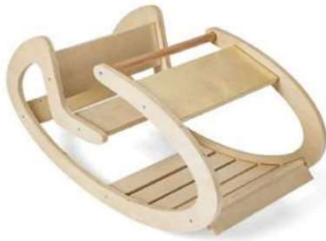
ROCKER GYT2153 5900168935204 Item: GYT21153