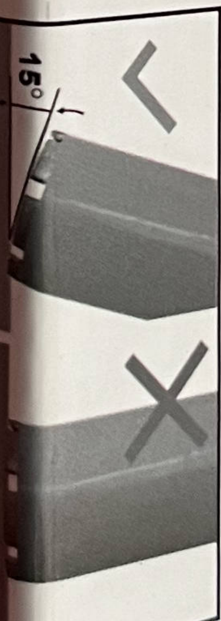
Boor de 1e aanzet in een hoek van 15 graden

INDUSTRIAL CORE DRILLS FOR PROFESSIONAL USE