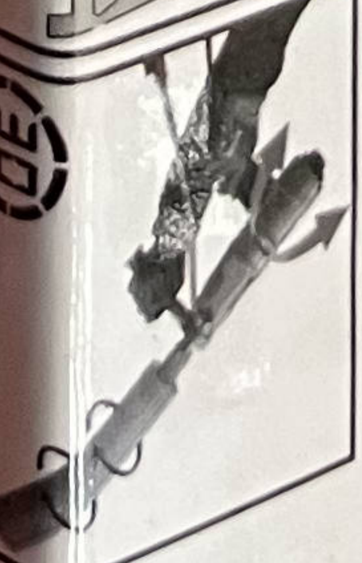
Koel de machine na