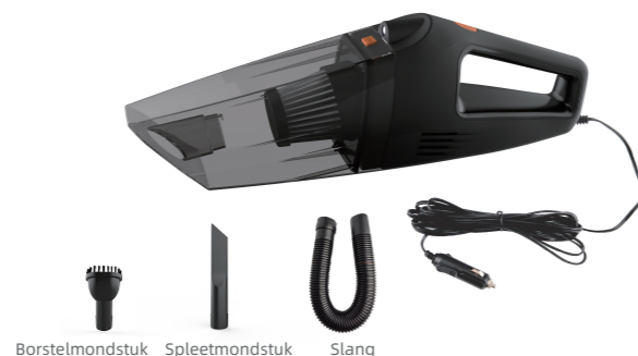
Borstelmondstuk Spleetmondstuk Slang