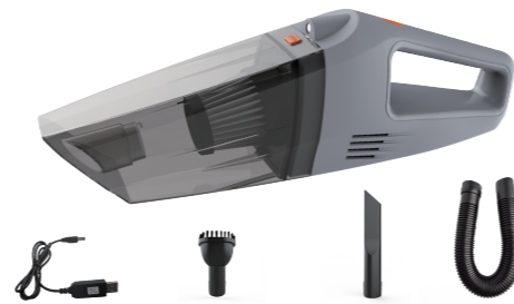
USB Oplaadkabel Borstel mondstuk Spleetmondstuk Slang