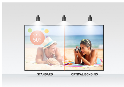
Optical bonded PCAP

Ook verkrijgbaar in het wit : ProLite T2752MSC-W1