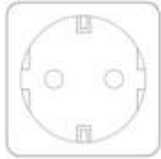
Smart Plug Gebruikershandleiding