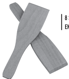
8 SPATULES EN BOIS