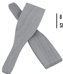
8 HOUTEN SPATELSHET