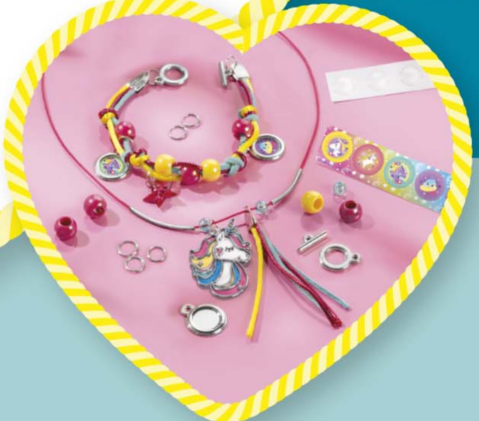
Designs and colours may vary from picture