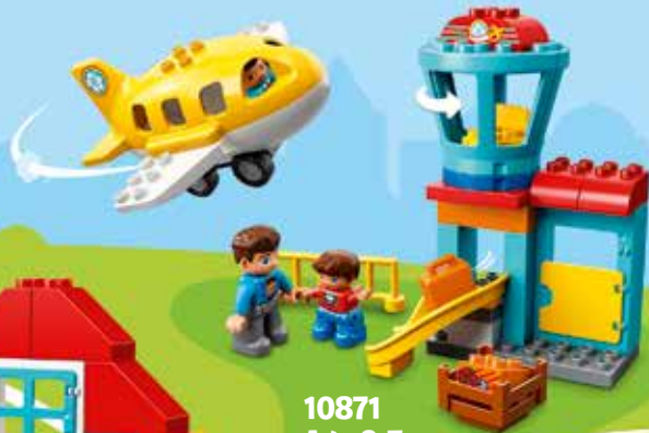
10871 Age 2-5