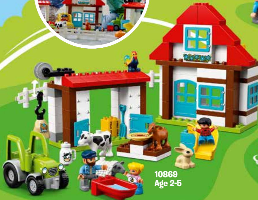
10869 Age 2-5