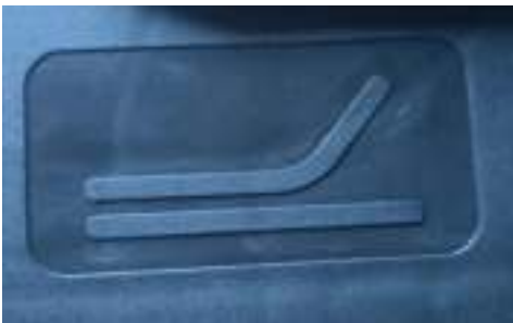
Afbeelding 1 – hoofdeind: