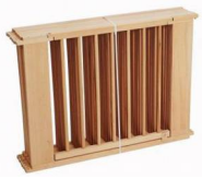
6 OF 8 PANELEN AFHANKELIJK VAN DE UITVOERING