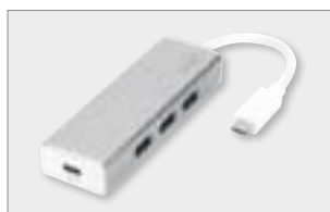
USB 3.0 3-Port Hub with Type-C™ Power Delivery Function