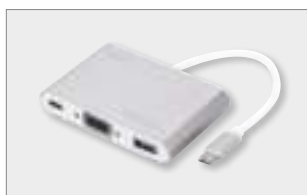
USB 3.0 Type-C™ VGA Multiport