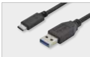
Type-C™ - A, M/M