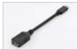
Type-C™ - A, M/F