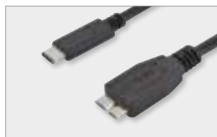
Type-C™ - micro B, M/M