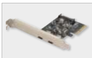
PCIe USB 3.1 Card Type-C™