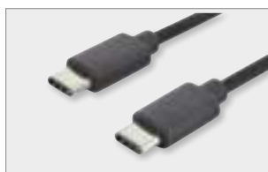
Type-C™ - C, M/M