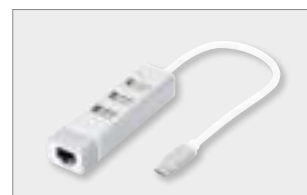
USB 2.0 3-Port Hub & Fast Ethernet LAN Adaptor with Type-C™ Connector