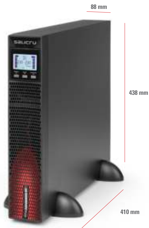
SPS 800÷3000 ADV RT2