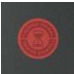
Thermo-Signal™ voor perfecte resultaten

De hoogwaardige Titanium Unlimited coating in de kookpannen gaat tot 6x langer mee vergeleken onze basis Titanium coating.* Dankzij de Titanium deeltjes kun je zelfs metalen spatels in deze pan gebruiken.