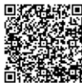
(Android QR Code)