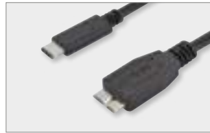
Type-C™ - micro B, M/M