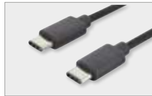
Type-C™ - C, M/M