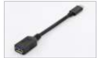
Type-C™ - A, M/F