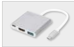
USB 3.0 Type-C™ HDMI Multiport