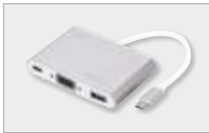
USB 3.0 Type-C™ VGA Multiport