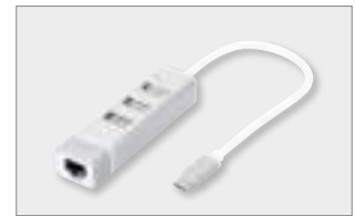
USB 2.0 3-Port Hub & Fast Ethernet LAN Adaptor with Type-C™ Connector