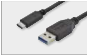
Type-C™ - A, M/M