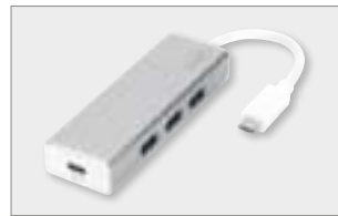
USB 3.0 3-Port Hub with Type-C™ Power Delivery Function