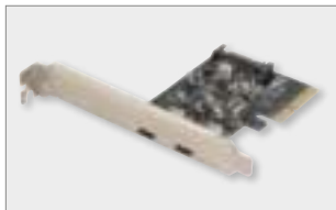
PCIe USB 3.1 Card Type-C™