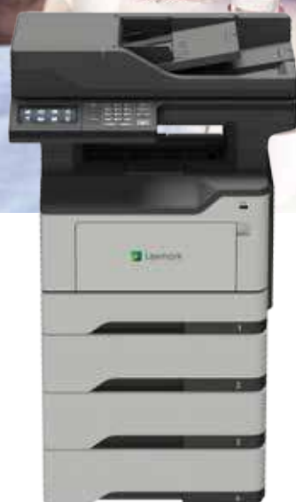
MB2546adwe avec bacs d'alimentation en option