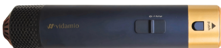
2. SalonQ 5 styler