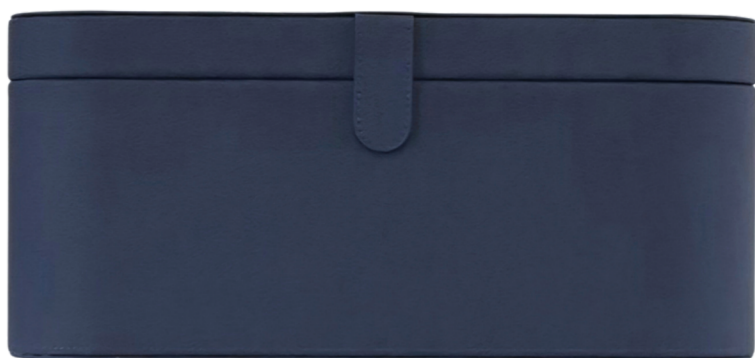
1. Lederen opbergbox