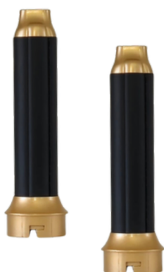
3. 2 x Aircurlers