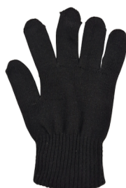
7. Hittebeschermende handschoen