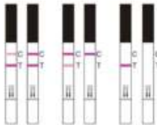
POSITIEF NEGATIEF ONGELDIGE TEST