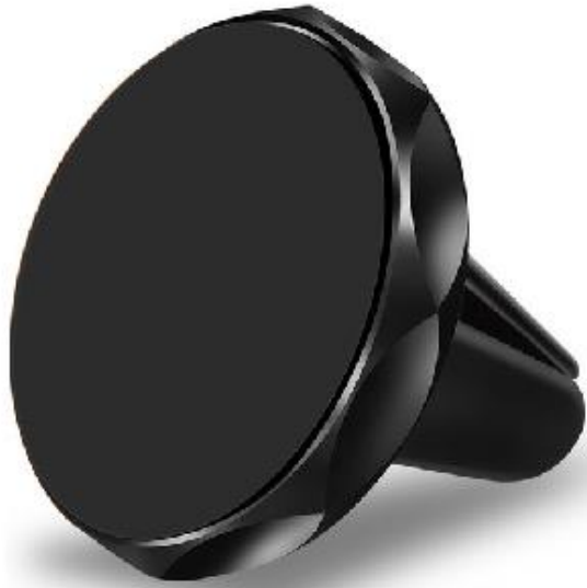
afmeting: 68x35x33 cm

In de verpakking vind u de volgende twee producten: