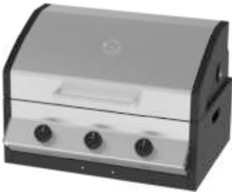
MERIDIAN 3 98510