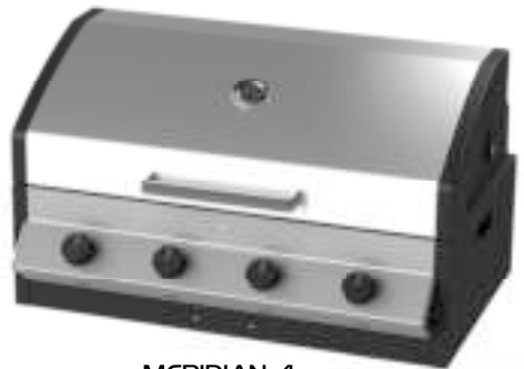
MERIDIAN 4 98512