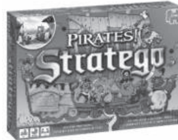
18164 Stratego Pirates!