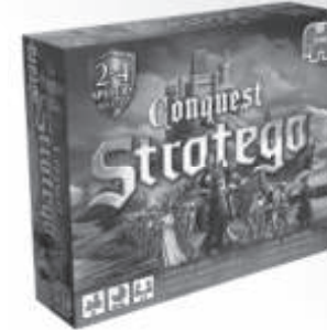
18122 Stratego Conquest