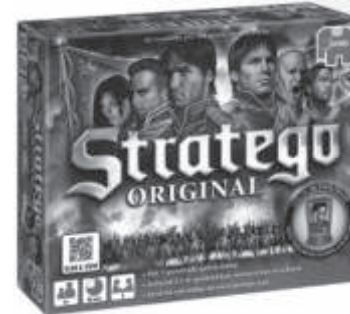
00495 Stratego Original