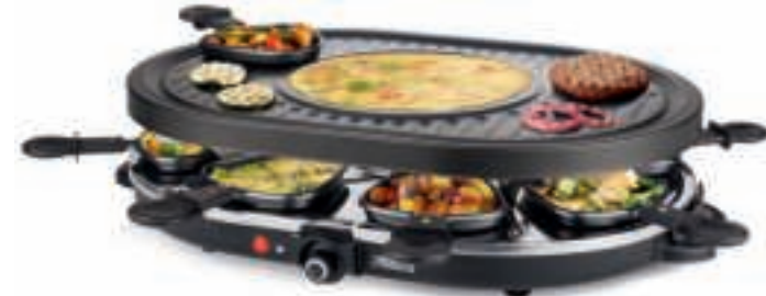
Raclette 8 Oval Grill Party 01.162700.01.001

PARTS DESCRIPTION / ONDERDELENBESCHRIJVING / DESCRIPTION DES PIÈCES / TEILEBESCHREIBUNG / DESCRIPCIÓN DE LAS PIEZAS / DESCRIÇÃO DOS COMPONENTES / DESCRIZIONE DELLE PARTI / BESKRIVNING AV DELAR / OPIS CZĘŚCI / POPIS SOUČÁSTÍ / POPIS SOUČASTI