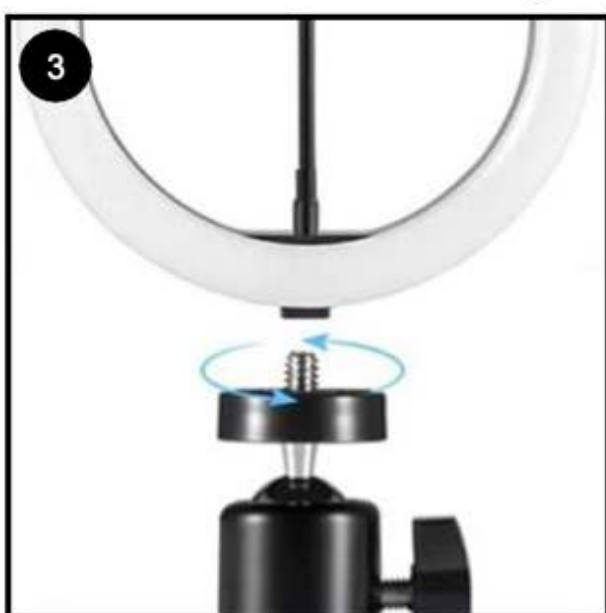
Draai de ringlamp op het balhoofd