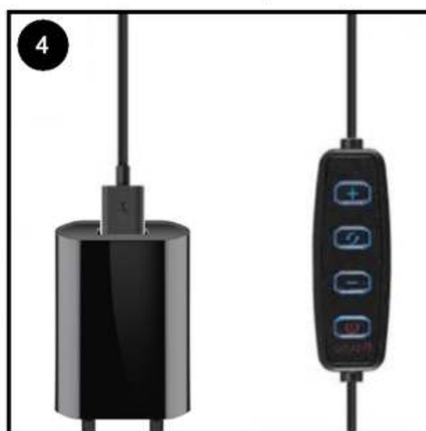
Stop de USB stekker in de voeding