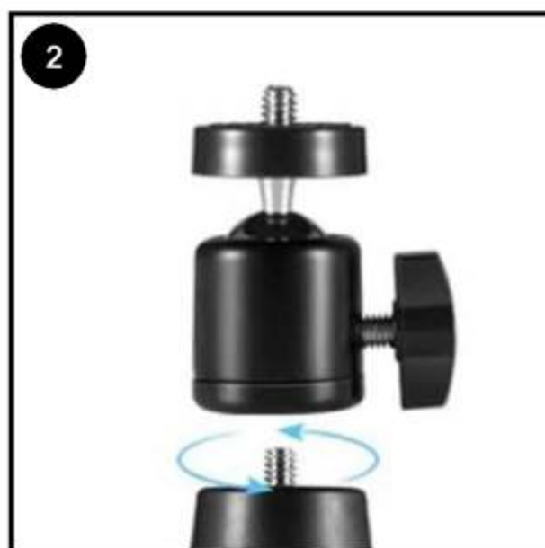
Draai het balhoofd op het statief