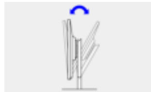
Kantelen Naar achteren 35°, naar voren 5°