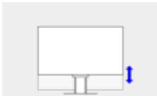
Hoogte 192,7 mm

Ergonomisch en stabiel: de verstelbare voet zorgt voor een gezonde lichaamshouding. U kunt de monitorvoet precies in die stand draaien en kantelen die voor uw rug, uw nek en uw zithouding het meest comfortabel is. De voet is bovendien traploos in hoogte verstelbaar en de monitor kan bijna tot op de bodemplaat van de voet worden verlaagd. Zo kunt u de bovenste regel in uw beeld net onder uw ooghoogte plaatsen voor een optimale ergonomische monitorpositie.