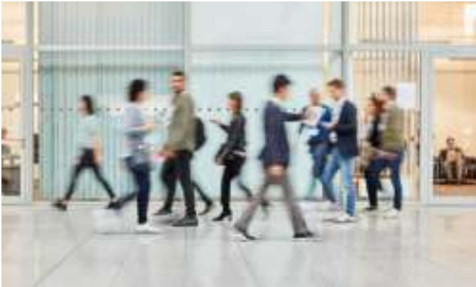
Zonder Overdrive: bewegingsonscherpte en vertraging

Snel, sneller, Overdrive. De Overdrive-functie versnelt het overschakelen tussen beelden, waardoor de grijs-naar-grijs-reactietijd gemiddeld slechts 5 ms bedraagt. Films en snelle overgangen tussen beelden ziet u zonder dat er nog iets van het vorige beeld achterblijft.