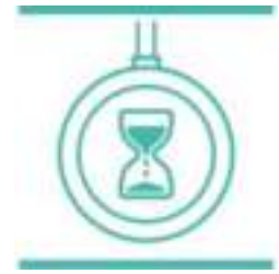
Thermo-Signal™ -technologie voor precisiekoken

0% PFOA, 0% lood, 0% cadmium* * Strengere controles dan die vereist worden door de huidige regelgeving rondom contact met levensmiddelen. Product bevat geen lood of Cadmium (geen Pb, geen Cd), ook niet in de antiaanbaklaag. Geen migratie op een meetniveau van 0,005 mg/kg.