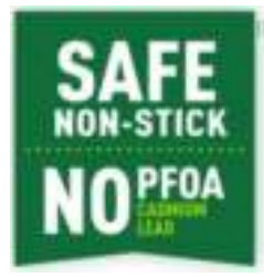
Veilige titanium coating

Superieure titanium coating, waardoor ingrediënten niet aanbakken en de pan makkelijk schoon te maken is.