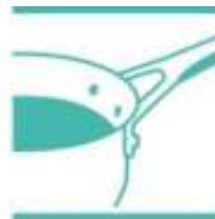
Geklonken RVS handgreep voor veilige grip.

Dankzij de Thermo-Fusion™ technologie wordt de pan snel warm en wordt deze warmte evenredig verspreid. Zo krijg je gelijkmatige bereidingen.