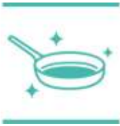
Stijlvol roestvrij staal

Stijlvolle roestvrijstalen pan die er net zo goed uitziet als hij kookt - perfect om op tafel uit te dinen. De pan heeft niet alleen een titanium coating, waardoor ingrediënten niet aanbakken, hij is ook super duurzaam en bestand tegen stoten.