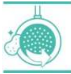
Superieure titanium coating

Stijlvolle roestvrijstalen pan die er net zo goed uitziet als hij kookt - perfect om op tafel uit te dinen. De pan heeft niet alleen een titanium coating, waardoor ingrediënten niet aanbakken, hij is ook super duurzaam en bestand tegen stoten.