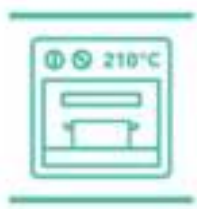
Ovenbestendig tot 210°C

De Thermo-Signal™ in de bodem van de pan geeft aan wanneer de ideale baktemperatuur is bereikt. Op deze temperatuur blijven texturen, kleuren en smaken behouden. Voor heerlijke, smaakvolle maaltijden, elke dag weer!