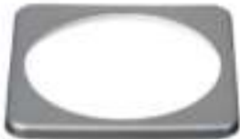
BMV-ring voor vierkant front