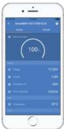
Zie het Discovery Sheet van de VictronConnect BMV-app voor meer schermafbeeldingen