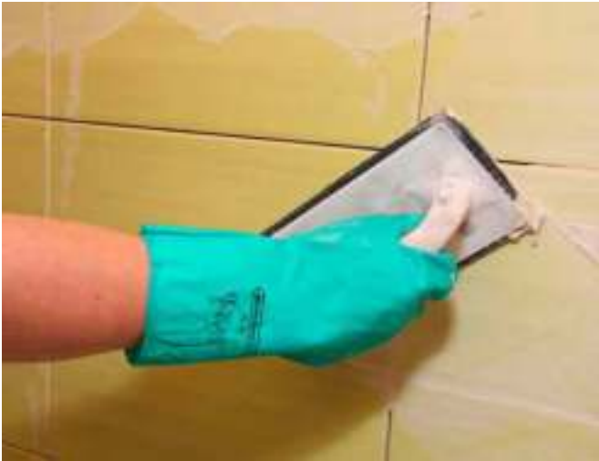
9 Het voegen van hard gebakken tegels met Sopro DF 10®.