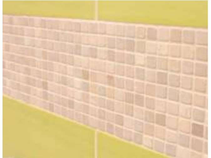
10 Oppervlakken van hard gebakken tegels en natuursteenmozaïek gevoegd met Sopro DF 10®.