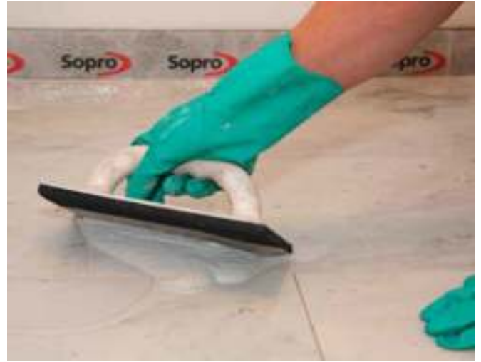
8 Het voegen van natuursteen gevoelig voor verkleuring met Sopro DF 10®.