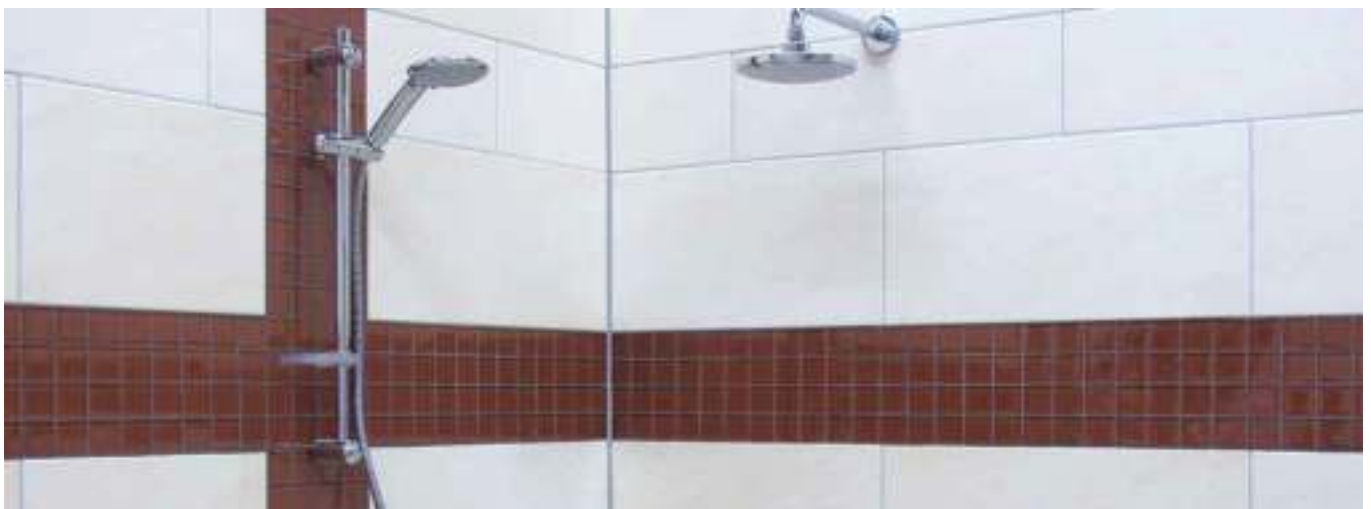
11 Gevoegde oppervlakken met een mooie kleurglans in een badkamer.