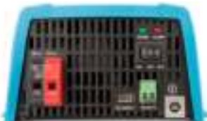
Phoenix 12/375 VE.Direct