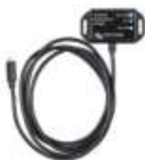
VE.Direct Bluetooth Smart dongle (moet apart worden besteld)

De BMV Battery Monitor combineert een geavanceerd microprocessorsysteem met zeer nauwkeurige meetsystemen voor meting van de accuspanning en de laad-/ontlaadstroom. Daarnaast bevat de software complexe berekeningsalgoritmen om de actuele laadtoestand van de accu precies te kunnen bepalen. De BMV geeft selectief de accuspanning, stroom, verbruikte Ah of resterende tijd weer. De monitor slaat bovendien belangrijke gegevens betreffende de prestaties en het gebruik van de accu op.