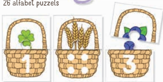
5 cijfer puzzels