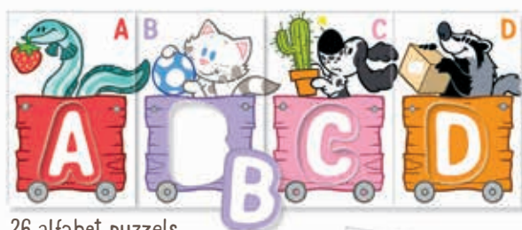
26 alfabet puzzels