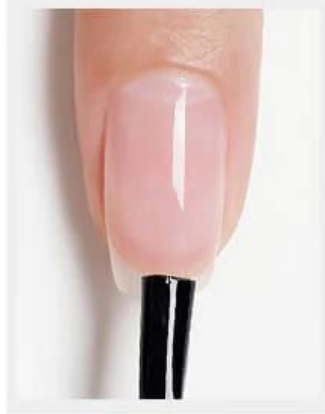
2. Breng de peelable base gel aan en laat het 1 á 2 minuten drogen in de lucht