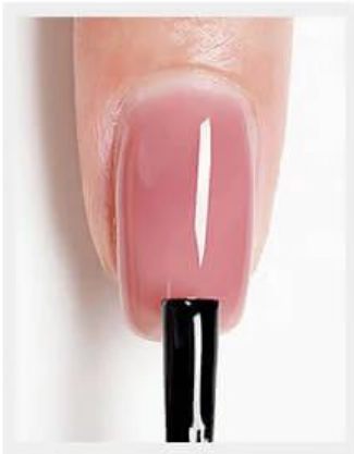
4. Breng de topcoat aan