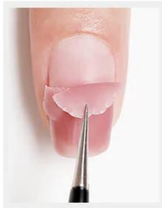
5. Gebruik een pincet om vanaf de nagelriemen de laag te verwijderen