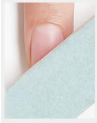
1. Bereid de nagel voor