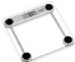
Bathroom Scale AD 8121