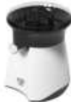
Citrus Juicer AD 4005