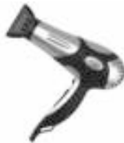
Hair Dryer AD 2224