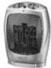
Fan Heater AD 7703