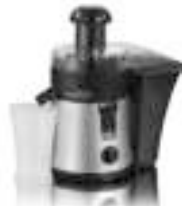
Juice Extractor AD 4106