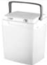
Portable cooler AD 8069