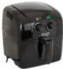
Air fryer AD 6307