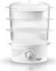
Steam cooker AD 633