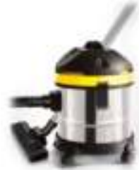
Canister vacuum cleaner AD 7022