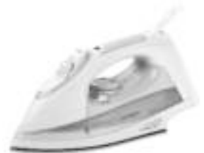
Steam Iron AD 5014