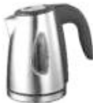
Kettle AD 1203