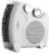
Fan heater AD 77