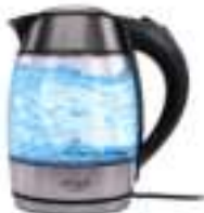
Electric kettle 1.8L AD 1246