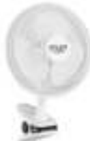
Desk fan 15 cm with clip AD 7317