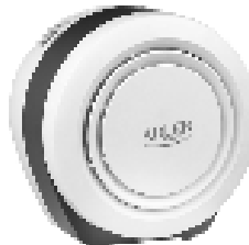
Air Purifier AD 7961