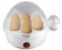
Egg Boiler AD 4459