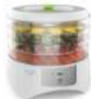
Food dryer AD 6654