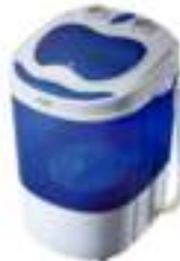
Mini washing machine with spinning function AD 8051