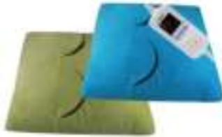
Electric heating pad AD 7403