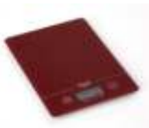
Electronic kitchen scale AD 3138