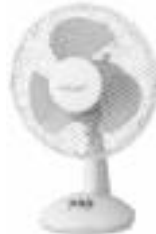
Table Fan AD 7302