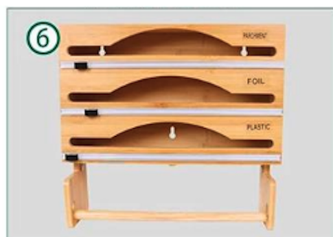
Bevestig de foliehouder op de door u gekozen plaats op de muur