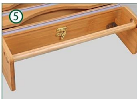
Plaats de buis in de keukenrolhouder door de buis door het vergrote gat te doen