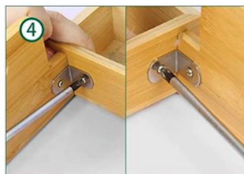
Bevestig de keukenrolhouder aan de foliehouder