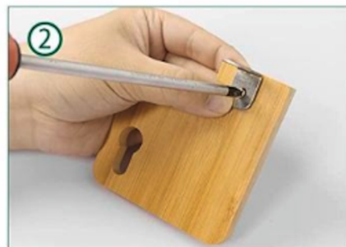
Bevestig de hoekstukjes met de bijgeleverde schroefjes aan de foliehouder