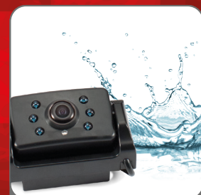
Rear camera Water and weather resistant IP65