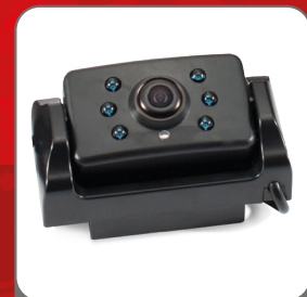
Digital camera Wireless video transmission