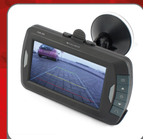
Display monitor With on-screen guideline option and suction cup bracket