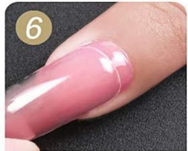
Remove the false nail tip