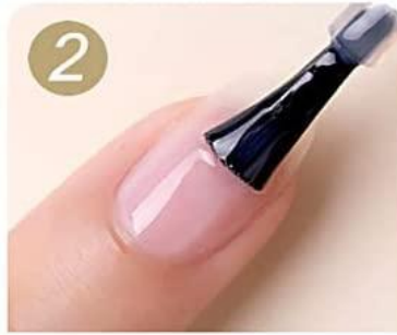
Apply a layer base coat, cure by lamp