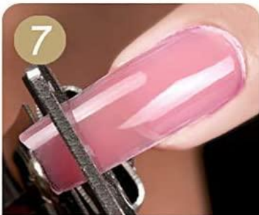
Trim the shape you like. Apply no-wipe topcoat, then cure by lamp. Finish.