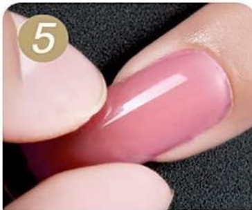
Stick it to your real nail and make sure it fully plying-up cure by lamp