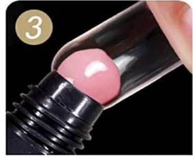
Choose suitable nail tip, apply poly nail gel