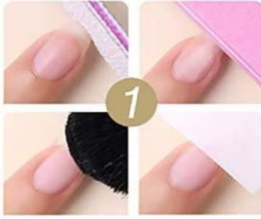
Trimming & clean nails