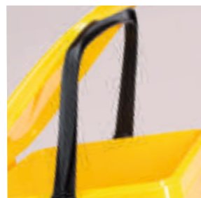
Manico con funzione di reggi coperchio