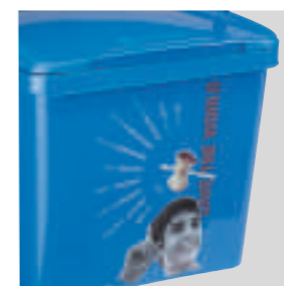
Personalizzazione foto iniettata (In Mould Label) sul corpo