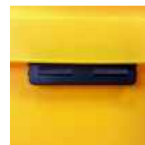
Predisposizione per l'applicazione transponder