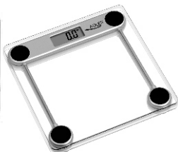
Bathroom Scale AD 8121