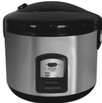
Rice cooker AD 6406