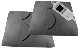
Electric heating pad AD 7403