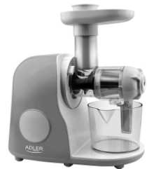
Slow juicer AD 4113