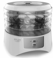
Food dryer AD 6654