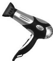
Hair Dryer AD 2224