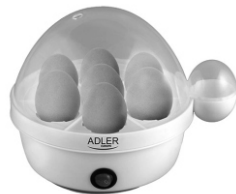
Egg boiler AD 4459