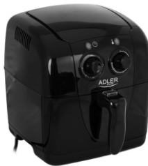
Air fryer AD 6307