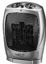
Fan Heater AD 7703