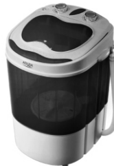
Mini washing machine with spinning function AD 8051