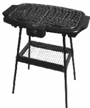
Electric grill AD 6602