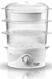
Steam cooker AD 633