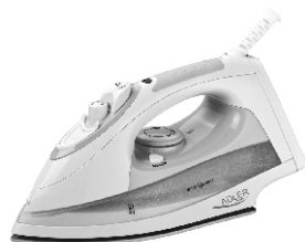
Steam Iron AD 5014