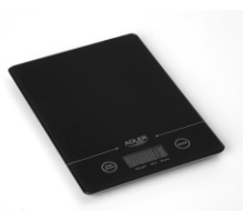
Electronic kitchen scale AD 3138