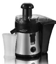
Juice Extractor AD 4106