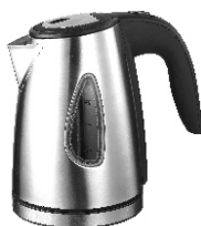
Kettle AD 1203