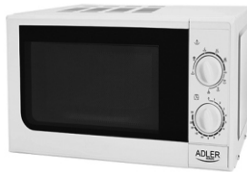
Microwave oven with grill AD 6204