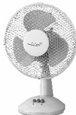
Table Fan AD 7302