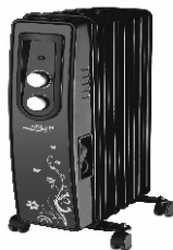
Oil-filled radiator AD 7801