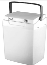
Portable cooler AD 8069