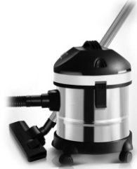
Canister vacuum cleaner AD 7022