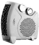
Fan heater AD 77