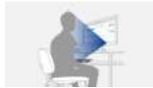
Sensor herkent persoon op werkplek

op de spaarmodus. Zodra u terugkeert, wordt het beeldscherm weer actief, volledig automatisch met behulp van de bewegingssensor.