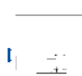
Hoogte 140 mm

Ergonomisch en stabiel: de verstelbare voet zorgt voor een gezonde lichaamshouding. U kunt de monitorvoet precies in die stand draaien en kantelen die voor uw rug, uw nek en uw zithouding het meest comfortabel is. De voet is bovendien traploos in hoogte verstelbaar en de monitor kan bijna tot op de bodemplaat van de voet worden verlaagd. Zo kunt u de bovenste regel in uw beeld net onder uw ooghoogte plaatsen voor een optimale ergonomische monitorpositie.