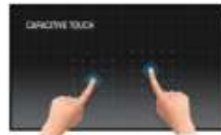
Touch technology - Capacitive

IPS-technologie biedt een hoger contrast, betere zwart-weergave en superieure inkijkhoeken t.o.v. de standaard TN-technologie.