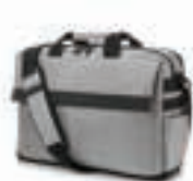
HP 15,6-inch (39,62-cm) Trend toploادتas L6V62AA